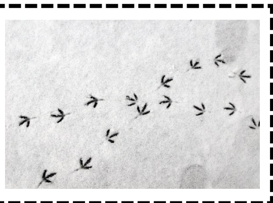
ANIFAIL – colomen wyllt